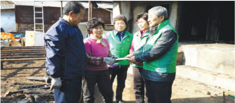
봉수면 새마을협의회가 화재로 주택을 잃은 이웃에게 성금을 전달했다.