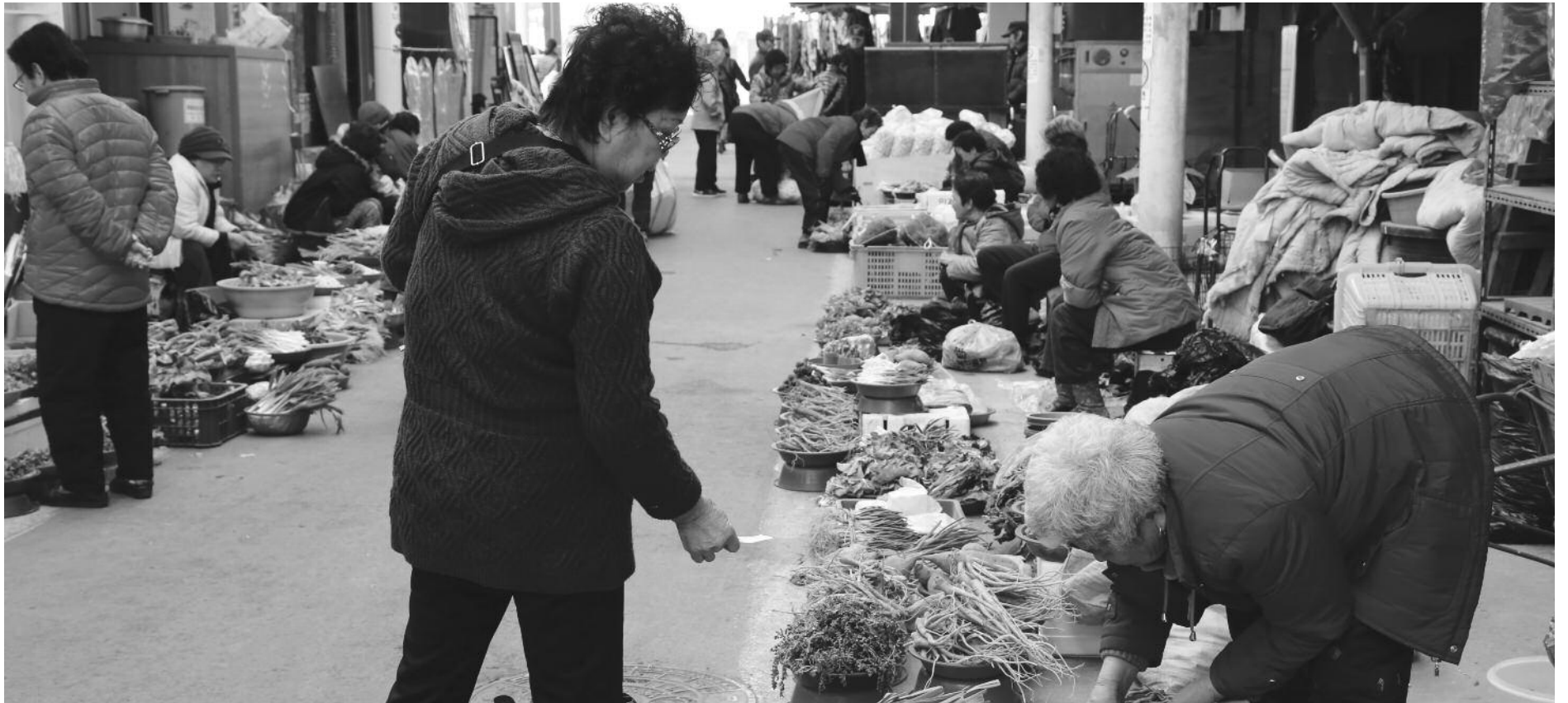
지금 의령전통시장에는 온통 봄나물이 내뿜는 향기와 싱그러움으로 가득하다. 썩은 물론이고 달래와 냉이, 썸바귀, 봄동, 돌미나리, 취나물까지 그릇마다 가득 담겨 손님을 기다리고 있다.