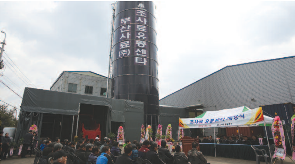
조사료 유통센터 개장식이 구룡공업공단 내에서 관내 조사료 경영체, 축산농가, 관계자 등이 참석한 가운데 열렸다.

군은 14일 의령읍 구룡공업공단내 부산 사료(주)에서 관내 14개 조사료 경영체, 축산농가, 관계자 등 100여명이 참석한 가운데 조사료 유통센터 개장식을 거행했다.