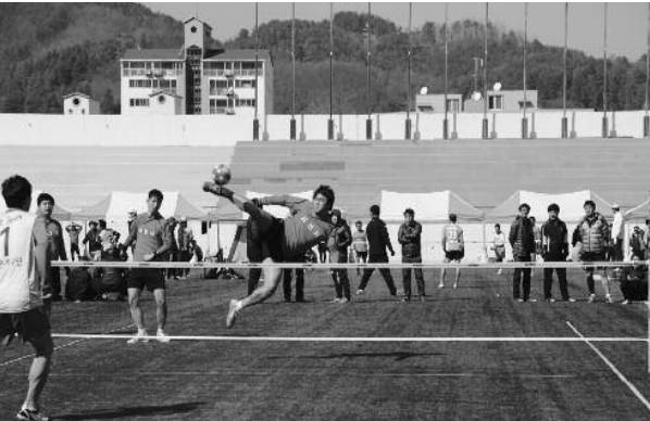
토요일에 의령군수배 영호남 클럽 족구대회에 1천여명의 대규모 선수단이 참가했다.