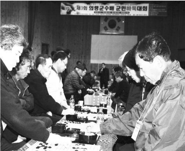
지난해 제3회 의령군수배 군민바둑대회. 올해는 경남도민대회로 확대 개최된다.