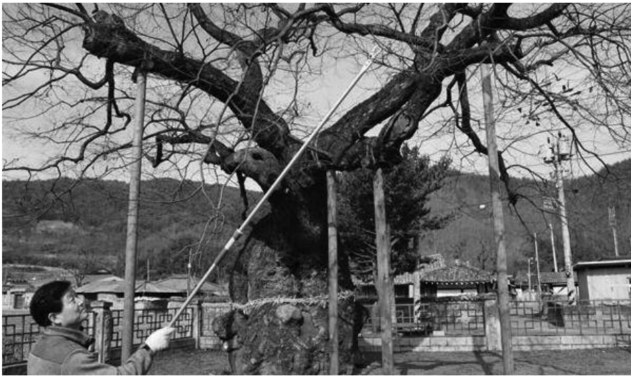
수령 600년에 높이 15m, 둘레 7m의 노거수 현고수.

의령군과 국립산림과학원, 문화재청은 공동으로 의령군 천연기념물의 우량 유전자를 길이 보호하기 위해 DNA 추출 및 복제나무를 만들어 유전자를 보존할 계획이다.