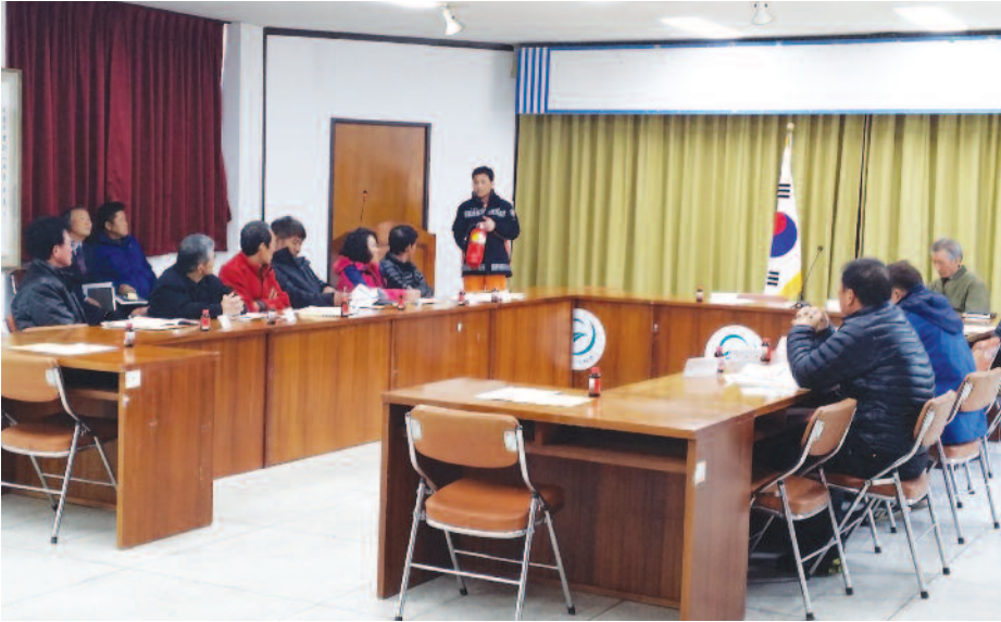
의령소방서 소방관들이 화재 사망사고 사례와 화재예방 교육을 실시하고 있다.