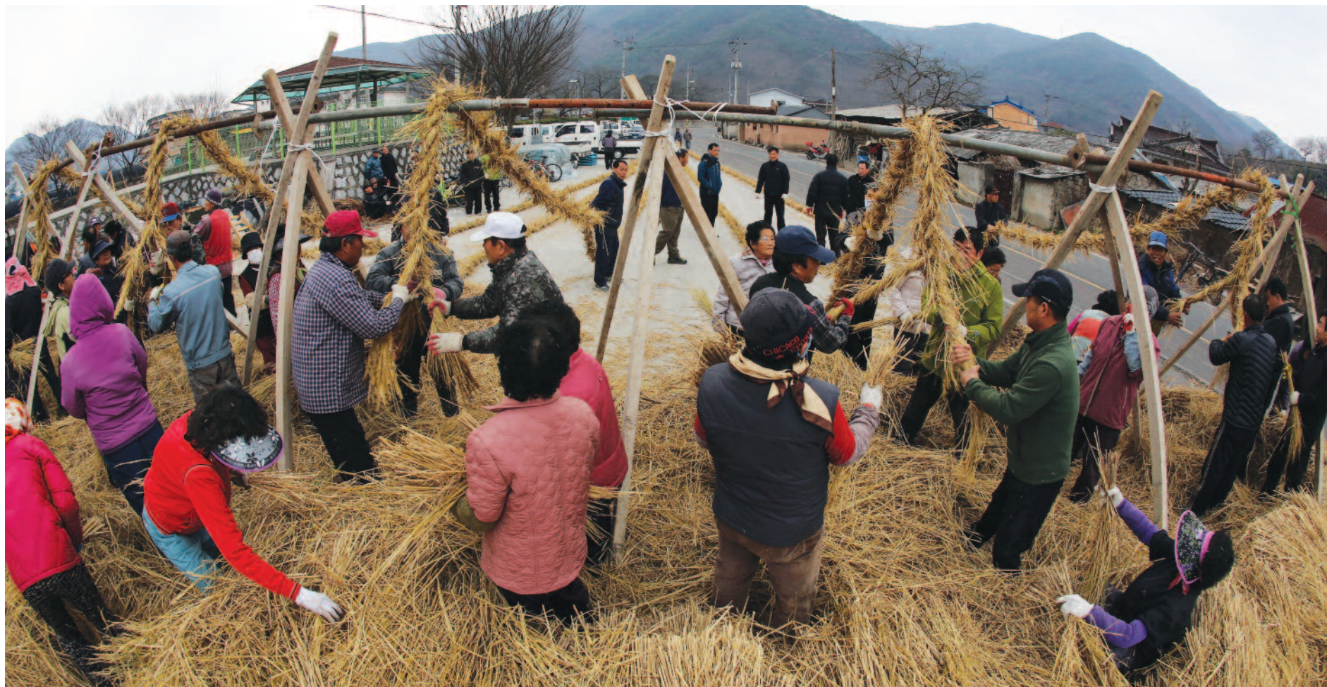
8, 9 양일 군 관내 대부분 마을에서는 1천여명의 주민들이 참여해 합심해서 벼짚을 나르고 새끼를 꼬느라 하루 종일 일손을 바쁘게 놀렸다. 가례면 주민들이 면사무소 앞 공터에서 작은 줄을 만들고 있다.

오는 6월1일 의병의 날을 맞아 3년 만에 열리는 의령큰줄쟁기기를 앞두고 마을별 작은 줄 만들기에 군민이 한마음으로 뭉쳤다. 3월 초 부터 시작된 작은 줄 제작은 휴일인 지난 8,9양일에는 군 관내 대부분 마을에서 1천여명의 주민들이 참여해 합심해서 벼짚을 나르고 새끼를 꼬느라 하루 종일 일손을 바쁘게 놀렸다.