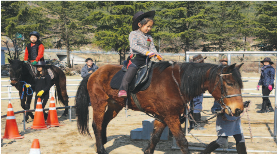
칠곡초등학교는 방과후 학습 프로그램으로 승마체험교실을 운영하고 있다.