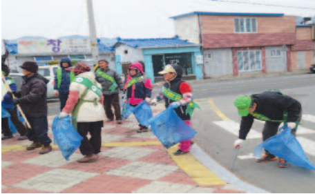
부림면 유관기관단체에서는 하천, 도로변 등의 쓰레기를 수거하고 캠페인도 실시했다.

▲ 큰줄쟁기기 줄 제작 기네스북에 등재된 의령큰줄쟁기기 줄 제작을 위해 부림면 각 마을별에서는 17일부터 31까지 작은 줄을 제작하고 있다. 마을별로 제작된 줄은 경산마을 창고에 일시 보관하였다 큰줄 제작에 들어가게 되는데 각 마을별로 배정된 작은줄 제작에는 마을 어르신, 부녀자, 어린이 등이 총 동원되어 정성을 들여 제작했다.