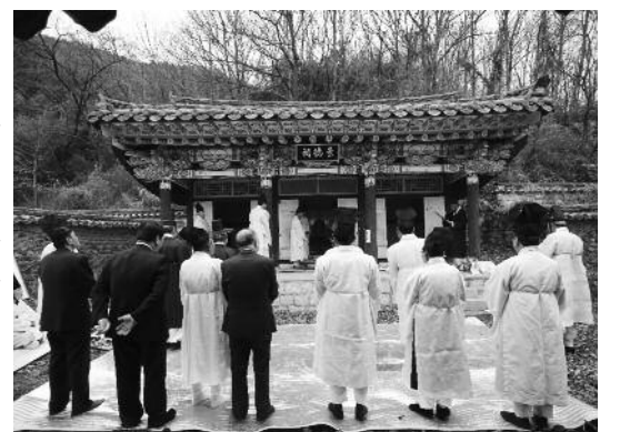
퇴계 이황의 학문과 덕행을 기리기 위한 춘향제례.

퇴계는 장인인 허찬 진사가 30여 년간 경북 영천군에서 살다 출생지인 의령 가례촌으로 낙향하면서 처가인 의령을 처음 방문했다. 선생은 이후 가례촌을 비롯한 인근의 함안, 진주 등지를 수차례 찾아 지역 유림들과의 학문적 교류와 강론으로 지방의 유학교육을 융성케 하는데 큰 영향을 주었다.