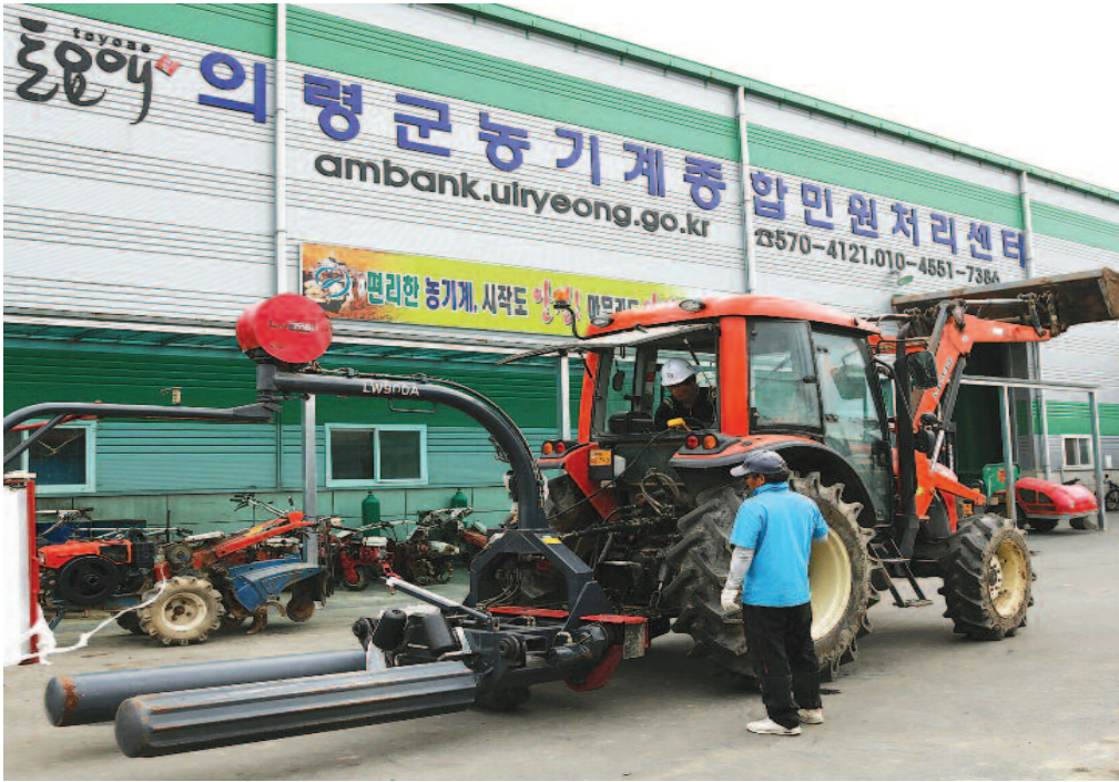
농기계 임대사업 확대를 위한 중부권 농기계 임대사업소가 신설돼 올 가을부터 가동된다.

군은 농가 경제에 가장 큰 비중을 차지하고 있는 농기계 구입비 경감을 위해 고가의 농기계를 구입해 농업인에게 저가로 임대하는 중부권 농기계 임대사업소 신설을 추진하고 있다. 올해 예산 12억원을 확보, 정곡면과 지정면 등 중부지역 농업인들이 더욱 편리하게 농기계를 임대할 수 있도록 의령농협 소유인 정곡면 백곡리 구 중부농협 가현 공판장의 부지와 창고를 매입하여 소유권 이전을 완료하고 임대사업소 설치를 준비 중이다.