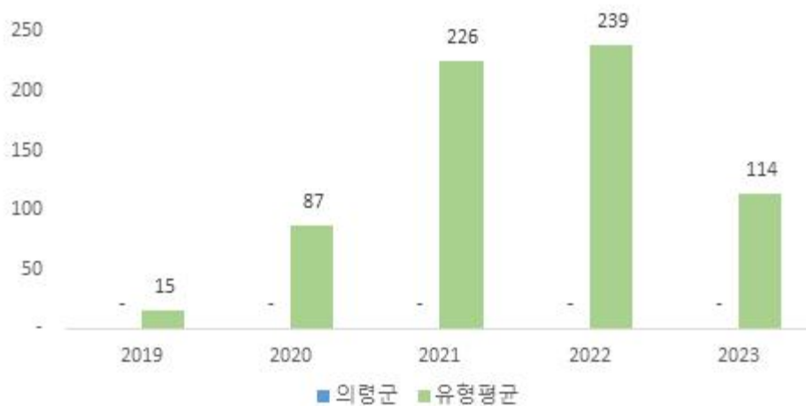
주민 1인당 채무 규모