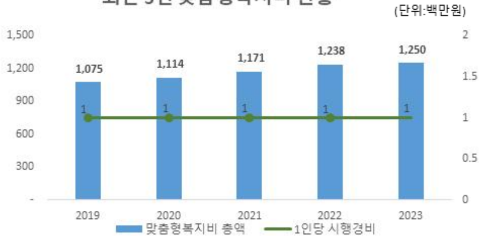
최근 5년 맞춤형복지비 현황

우리군의 맞춤형복지제도 시행경비 지급총액은 1,250백만원(작년 대비 12백만원 증가)입니다. 지급총액이 늘어난 이유는 대상인원이 작년대비 10명 증가했기 때문입니다.